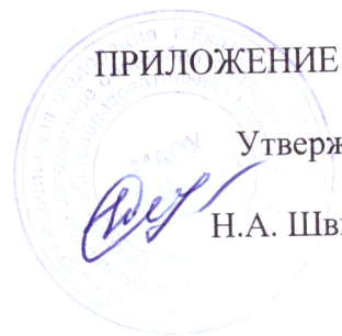
График проведения школьного этапа всероссийской олимпиады школьников в муниципальном образовании «город Екатеринбург» в 2020/2021 учебном году